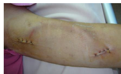
人工血管 約4周後血管才能成熟使用