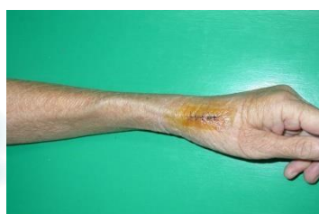
自體動靜脈瘻管 約1至3個月後血管才能成熟使用