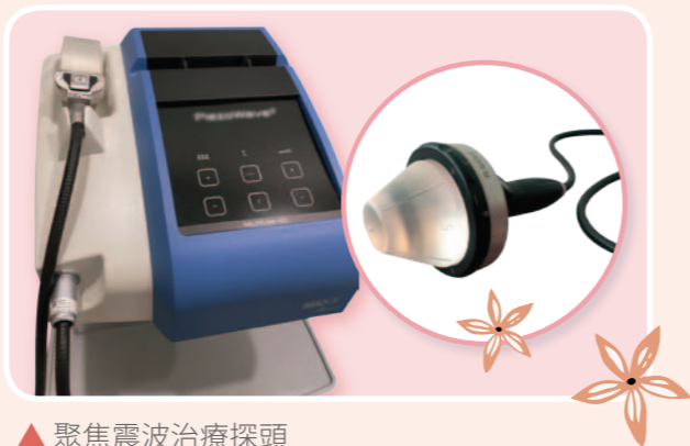
▲ 聚焦震波治療探頭

「低能量震波治療」是由醫師使用特製的矽膠探頭，貼著會陰部的皮膚，讓震波能量穿過組織，聚焦在攝護腺或骨盆腔的病灶上，刺激骨盆腔內產生血管新生，改善骨盆的血液循環，加速代謝造成疼痛的發炎物質，也